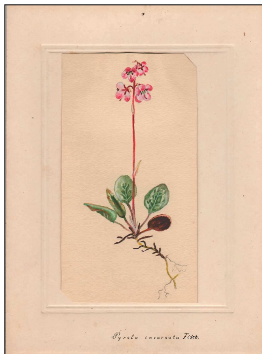
Pyrola incarnata Fisch.