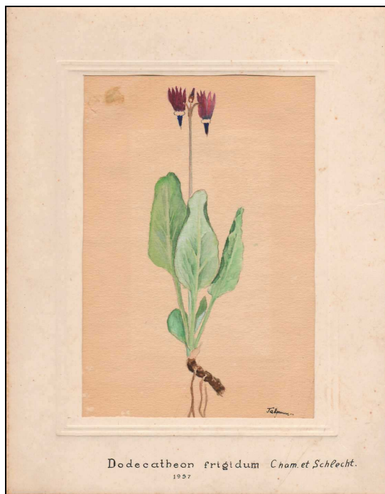
Dodecatheon frigidum Cham. et Schlecht.