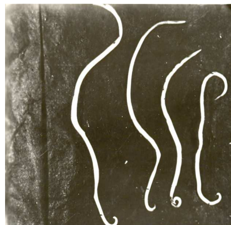
Рис. 4. Кореляція розмірів тіла самців аскариди людської від частоти інвазії (збільшення 8×4)

Нами були зроблені спроби виявити відмінності розмірів тіла паразита відповідно до віку хазяїна (табл. 2).