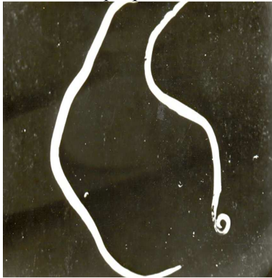
Рис. 1. Статевий диморфізм аскариди людської (збільшення 7×8)

Морфологічні особливості. Дорослі аскариди мають веретеноподібну форму тіла. Живі, чи відразу після виходу з кишечника, аскариди червонувато-жовтого кольору, після загибелі вони стають брудно білими. Самець аскариди помітно менший від самки, довжина його 15-25 см і задній кінець тіла гачкоподібно загнутий (рис. 1). Самка аскариди має рівне тіло завдовжки 25-40 см і 3-6 мм в діаметрі (рис. 2) [4].