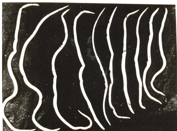
Рис. 3. Кореляція довжини тіла аскариди людської від частоти інвазії (самки, збільшення 8×4)

Візуальне підтвердження зміни розмірів від числа інвазії демонструють фотографії 3 та 4, де помітне зменшення розмірів аскарид при збільшенні інтенсивності інвазії.