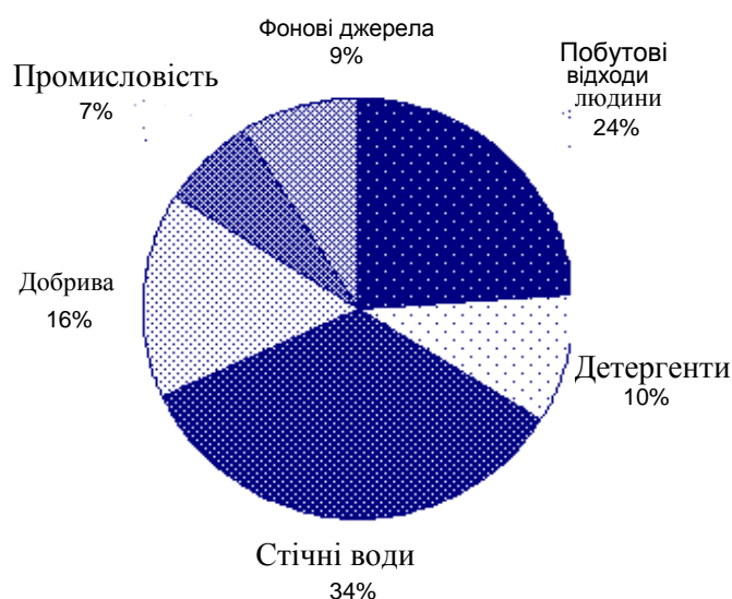
Мал. 1. Основні джерела надходження фосфору у водойми [13].

Джерелами надходження фосфатів з урбанізованої території в основному є побутові стічні води. Згідно з будівельними нормами і правилами, в СРСР в побутових джерелах води середній вміст фосфору на одну людину за добу становив 3,3 г [4], а згідно з даними Кульського Л.А. [3], від 0,75 до 5,0 г фосфору. Близькі значення встановлені зарубіжними дослідниками. Закордонні дослідники приводять також значення викидів фосфорних сполук з побутовими стоками у розрахунку на одного жителя 2-5 г., яке за використання детергентів збільшується в 2,5 рази в стічних водах у США та на 85% у Англії [4].